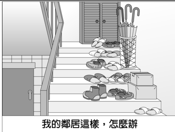
我的鄰居這樣，怎麼辦